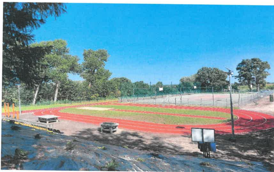
Zdjęcie Nr 6. Widok na bieżnię owalną obiektu