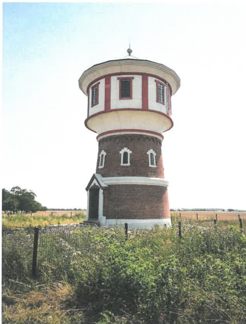
Zdjęcie Nr 9. Wieża ciśnień w Mogilnie