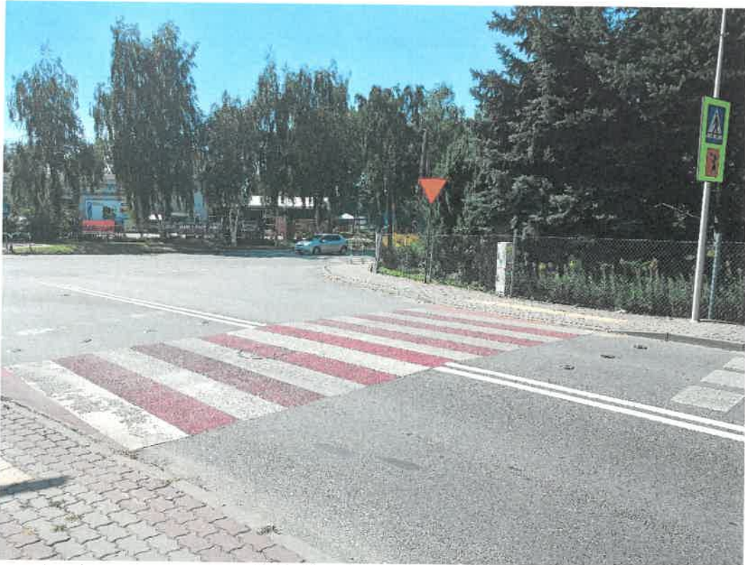
Zdjęcie Nr 5. Bezpieczne przejście dla pieszych na ul. Powstańców Wlkp. w Mogilnie