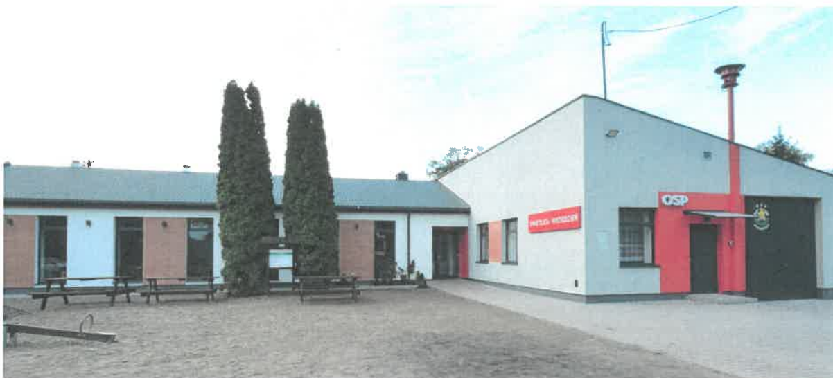
Zdjęcie Nr 8. Widok na elewację południową