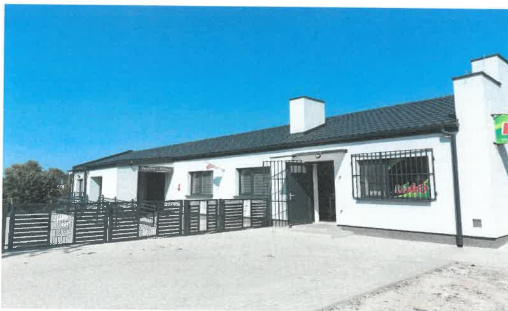
Zdjęcie Nr 7. Widok na elewację zachodnią