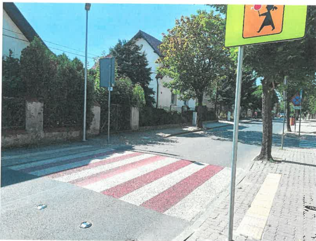
Zdjęcie Nr 3. Bezpieczne przejście dla pieszych na ul. Piłsudskiego w Mogilnie