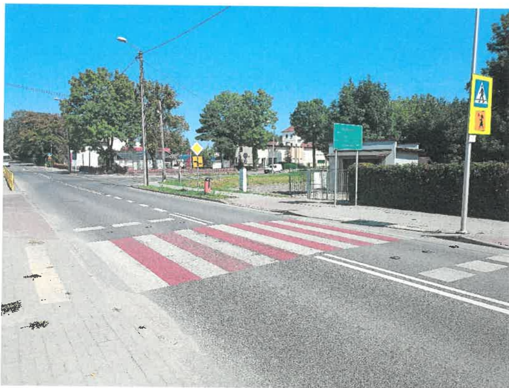
Zdjęcie Nr 4. Bezpieczne przejście dla pieszych na ul. Mickiewicza w Mogilnie