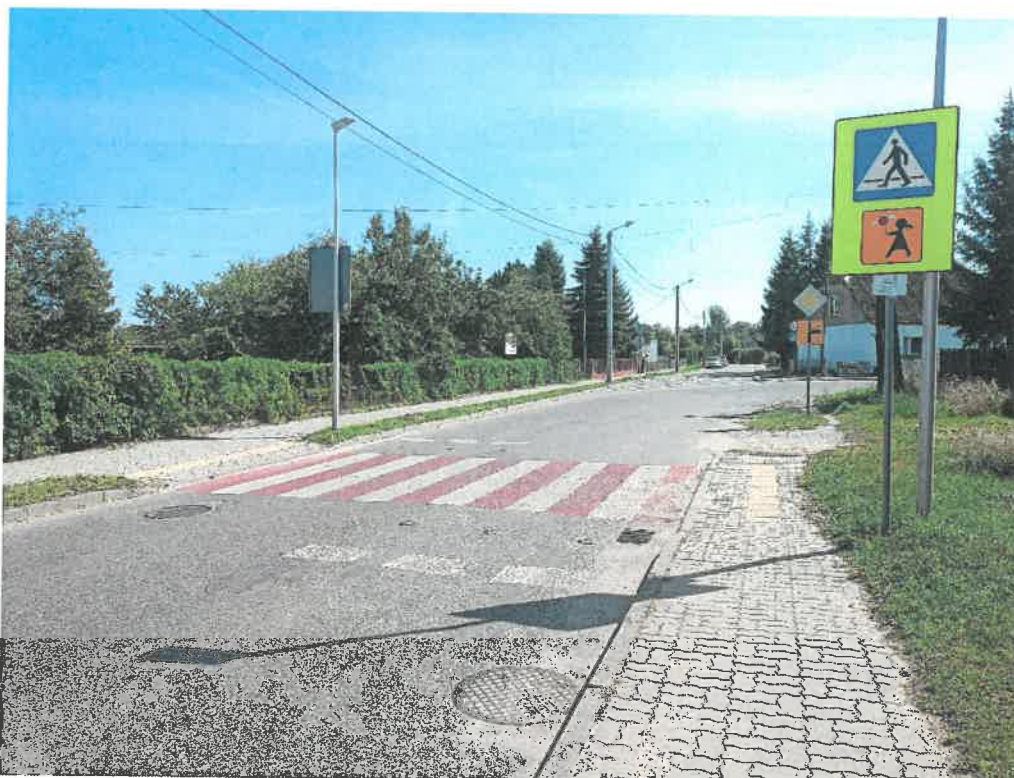
Zdjęcie Nr 1. Bezpieczne przejście dla pieszych na ul. Konopnickiej w Mogilnie