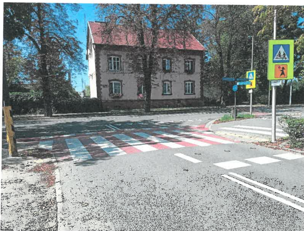
Zdjęcie Nr 2. Bezpieczne przejście dla pieszych na ul. Narutowicza w Mogilnie